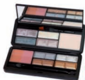
Completo 8 cores + Base + Ruge