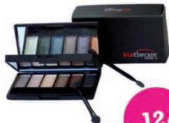
Doble Estuche 12 sombras