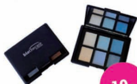
Tutto Blue 6 sombras