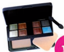
Tutto Color 8 sombras da Moda + Base