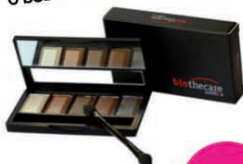
Tutto Terra 5 sombras