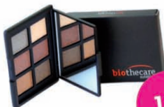
Tutto Brown 6 sombras